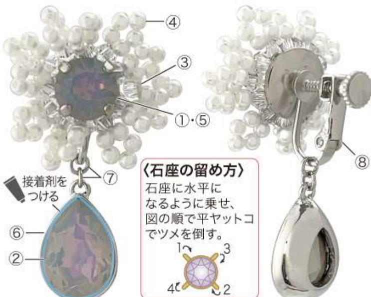
〈正面〉 ※もう片耳分も同様に作る。〈裏面〉

〈石座の留め方〉を参照し、①を石座(⑤)に留める。 パールは塗料でつながっているものはバラバラにし、 全てのパールの穴のカスを目打ちなどで取り除く。